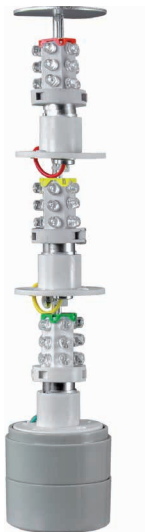
Рис. 1 — светодиоды на плате управления (питание выключено)*